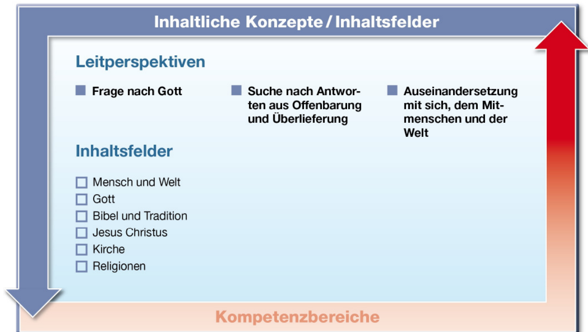
Abb. 2: Leitperspektiven und Inhaltsfelder im Fach Katholische Religion

Christlicher Glaube erschließt sich den Lernenden in Auseinandersetzung mit eigenen Erfahrungen und Überzeugungen sowie mit den Erfahrungen und Überzeugungen anderer. Dazu sind die Perspektive anderer Konfessionen, Religionen und Weltanschauungen, die Perspektive anderer Fächer und Wissenschaften sowie die Perspektive von Kunst, Kultur und Medien bedeutsam. Diese dialogische Erschließung erfordert von allen Beteiligten die „Bereitschaft und Fähigkeit, die eigene Perspektive als begrenzte zu erkennen, aus der Perspektive anderer sehen zu lernen und neue Perspektiven dazuzugewinnen“. 7